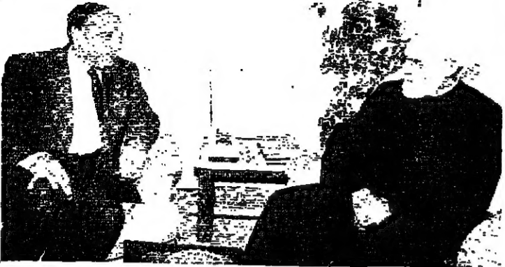
الشيخ شمس الدين والسفير شاش